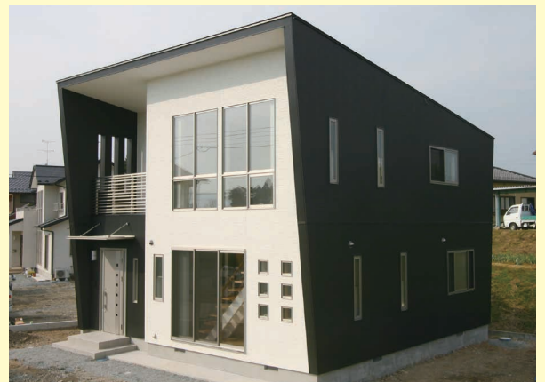
(石上 K様邸) 明るくて、清潔感のある広々としたリビング!!

工務店だからこそ造れる オーダーメイド住宅をご覧ください! お客様の要望にあわせてオリジナルプランにて当社建築士がデザイン します。すべての住まいが個性的で特徴のある建物となっております。